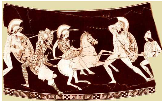
Ο Θησέας 30 και οι Αμαζόνες, παράσταση αρχαίας ελληνικής μυθολογίας

Αργότερα, όταν η αυτοκρατορική πομπή έφθανε για επιθεώρηση την περιοχή της Μπαλακλάβα, μια άλλη μεγάλη έκπληξη περίμενε τους αυτοκράτορες και την ακολουθία τους. Τους υποδέχθηκε ένας Λόχος 100 περίπου έφιππων γυναικών, σε άψογη στρατιωτική τάξη, ένας «Λόχος Αμαζόνων» 29 , που τους συνόδεψε αποδίδοντας τιμές στους δύο αυτοκράτορες και τους λοιπούς επισήμους!