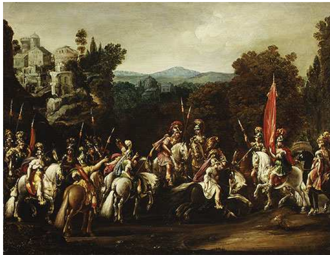
Η αναχώρηση των Αμαζόνων , Claude Deruet, 1820

Όταν όλη η πομπή έφθασε στο κέντρο της Μπαλακλάβα, ο Πατιόμκιν που συνόδευε την Αικατερίνη ΙΙ έδωσε την άδεια στην αρχηγό του Λόχου των Αμαζόνων, Ελένη