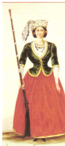
Η ενδυμασία των Ελληνίδων Αμαζόνων

Μετά από μικρό χρόνο ο Λόχος των Αμαζόνων διαλύθηκε.