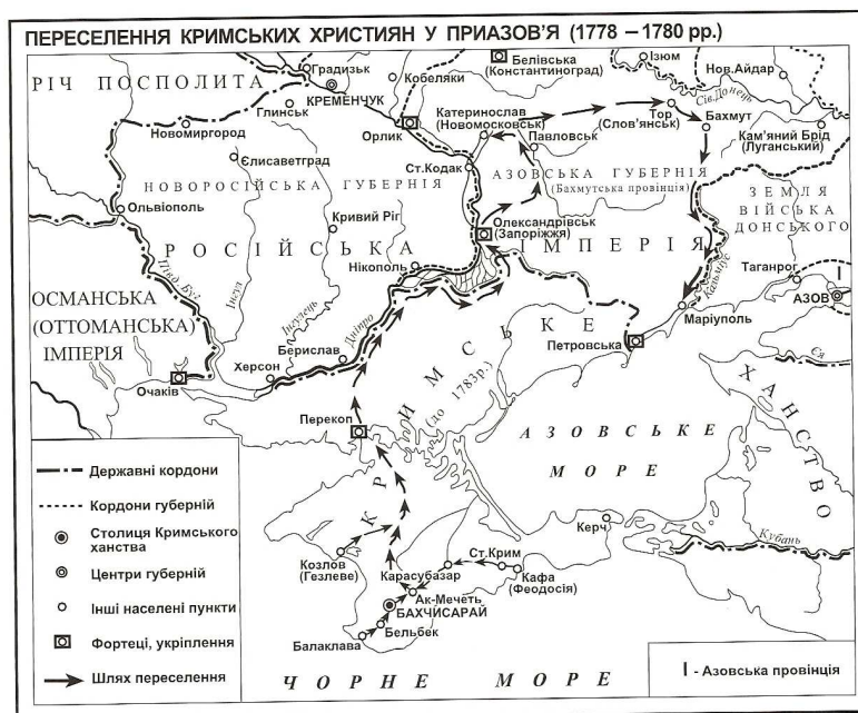
Χάρτης που εμφανίζει τη μετακίνηση Χριστιανών κατά την περίοδο 1778-1780 από τη Νότια Κριμαία προς τη Βόρειο Ανατολική με κατάληξη τη δημιουργηθείσα Μαριούπολη 9 .

Στην περιοχή της Μπαλακλάβας εγκαθίστανται οι Έλληνες μετά την προσάρτηση της Κριμαίας από τη Ρωσία το 1783. Ουσιαστικά όμως, ο εποίκισμός άρχισε το 1784, ως μέρος ενός εθελοντικού Τάγματος, που το αποκαλούσαν 'Ελληνικό στράτευμα του Ορλωφ' 8 , αποτελούμενο από άνδρες του Αρχιτελάγους, που στην πραγματικότητα όμως αποτελούνταν από πολλά Τάγματα Ελλήνων και άλλων μαχητών.