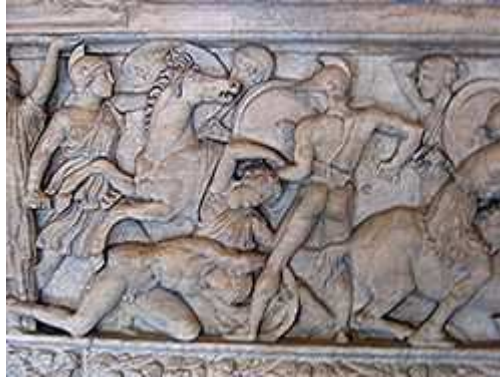
Μάχη μεταξύ Ελλήνων και Αμαζόνων από ανάγλυφο σαρκοφάγου, 180 π.Χ., Λούβρος

των Ελλήνων της Κριμαίας και την ισότητα των Ελλήνων και των συζύγων των, όπως και στην αρχαία Ελλάδα, τα οποία υποσχέθηκε να αποδείξει κατά την άφιξη της στην Κριμαία. Σύμφωνα με αρχαιακή πηγή του 1844 32 «... Η συνάντηση με την αυτοκράτειρα είχε προγραμματιστεί στο ελληνικό χωριό Kadykonki, κοντά στην Μπαλακλάβα. Στην περιοχή της συνάντησης ο δρόμος είχε στρωθεί με δάφνες, ραντισμένες με πορτοκαλιές και λεμονιές, ... στο τέλος της λεωφόρου, που εκτείνονταν σε έξι χιλιόμετρα, στήθηκε μια σκηνή, μέσα στην οποία υπήρχαν τοποθετημένα επάνω σε έναν πίνακα ευαγγέλιο, σταυρός, ψωμί και αλάτι.... ».